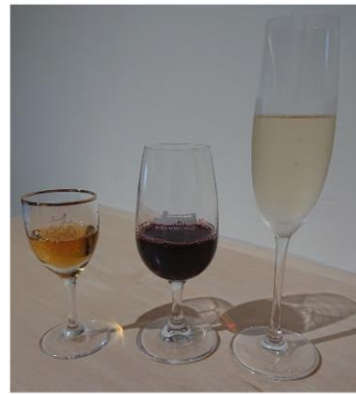
ワインテイスティング